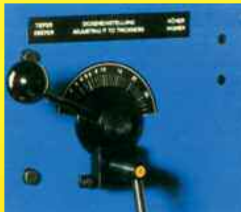
Un seul levier pour régler la hauteur des têtes.

Très silencieuse la KM 16 passe de l'agrafage à plat à l'agrafage à cheval en quelques secondes par simple basculement de la table de travail. Une touche coup par coup facilite les opérations de réglage.