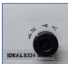
BOUTON DE SELECTION Réglage facile du pli en quelques secondes grâce au bouton de sélection.