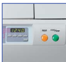
UTILISATION SIMPLIFIEE Touches de fonctionnement et display permettent une utilisation facile de la machine.