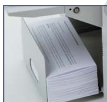
EJECTION DU PAPIER Selon le type du pli, le plateau de réception peut recevoir jusqu'à environ 80 feuilles pliées.